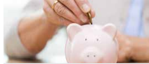
Gemeente 'vergeet' belastingen p.3