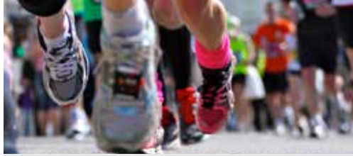
Levensloop tegen kanker p.2