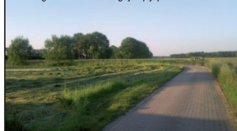
Bij de verkaveling die hier komt, houdt men te weinig rekening met enkele belangrijke pijnpunten.

De N-VA-fractie heeft zich natuurlijk met inzet verweerd, overeenkomstig onze visie op mobiliteit, ruimtelijke ordening en natuurlijk openheid van bestuur. Die visie kan u nalezen in het verkiezingsprogramma op onze website.