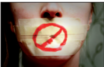
De N-VA laat zich niet monddood maken door de meerderheid.

Dat we als nieuwe partij meteen konden rekenen op 932 blijken van vertrouwen, blijft ons tot op vandaag nog verbazen. Al die kiezers grepen de kracht van verandering aan om vanuit verschillende partijen de overstap te maken. Dankzij jullie staat er nu een stevige en brede oppositie op het veld om te wegen op het beleid.