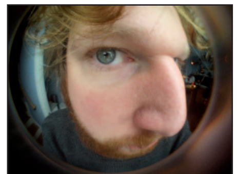
Neem zelf eens een kijkje op de gemeenteraad.

U zal vanaf nu dus hier moeten vernemen wat er gebeurde in de gemeenteraad. Of beter nog: Kom zelf een kijkje nemen. Jullie volgende kansen om ze bij te wonen zijn op 2 en 30 september, 4 november en 16 december. Spreek gerust een van onze N-VA-aanwezigen aan en verdeel met uw recht op inspraak.